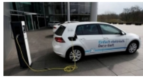
【私銀觀】亞洲新型出行領域存機會 李智穎 | 財富管理