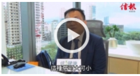
【十二生肖X傳染病】鼠：鉤端螺旋體病 信健康